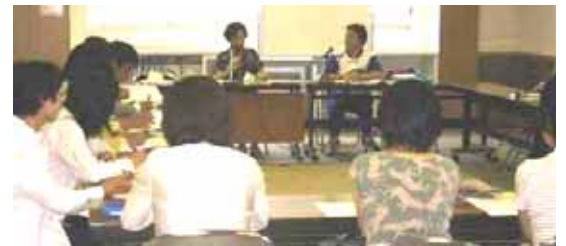
次世代育成支援計画を考える