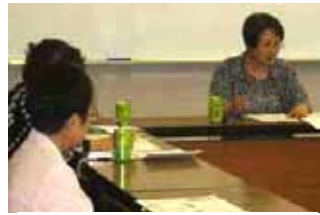
職場での・家庭での男女平等 15年にわたる男女差別是正裁 判を通して男女平等を考える