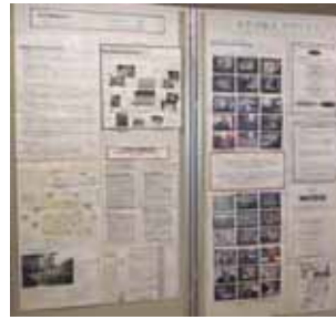
「男女平等生活の実現 終のすみか/仲間との共同生活の例」展