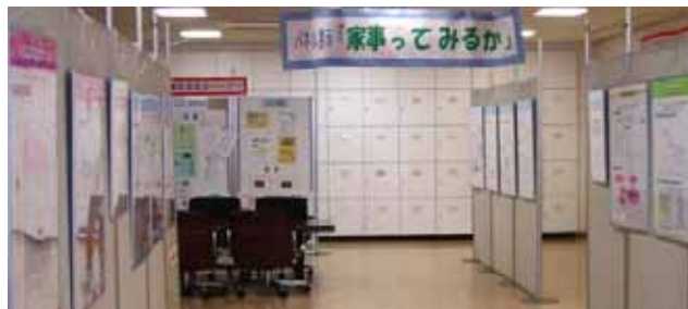
「家事ってみるか」パネル展