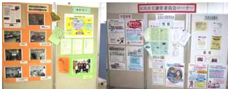
特定非営利活動法人男女共同参画おおた と 区民自主運営委員会コーナー