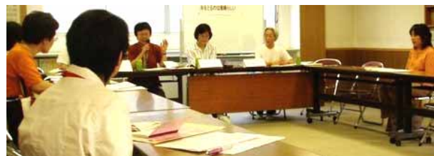
産むだけが女の役割ですか？ 年をとるのは素晴らしい！！