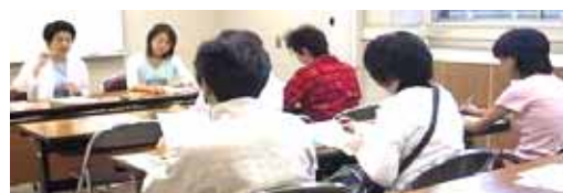
自分らしく輝くために 自分を大切にできる 心の護身術