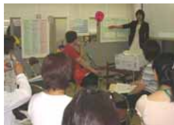
韓国ドラマにみる男と女