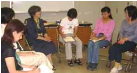
身近なパートナーシップについて