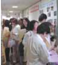
映画 「死ぬまでにしたい10のこと」が 終わって