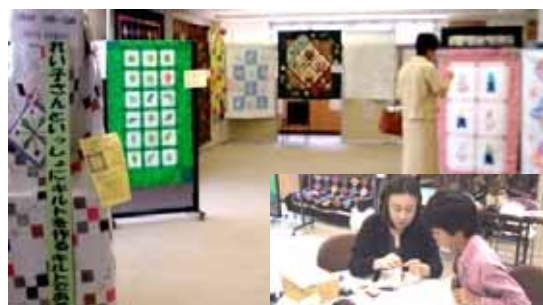
れい子さんと一緒にキルトを作るキルトであそぼ