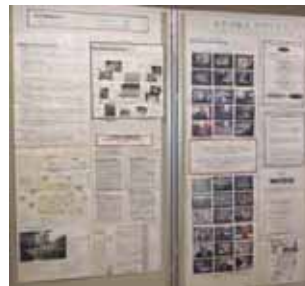
「男女平等生活の実現 終のすみか/仲間との共同生活の例」展