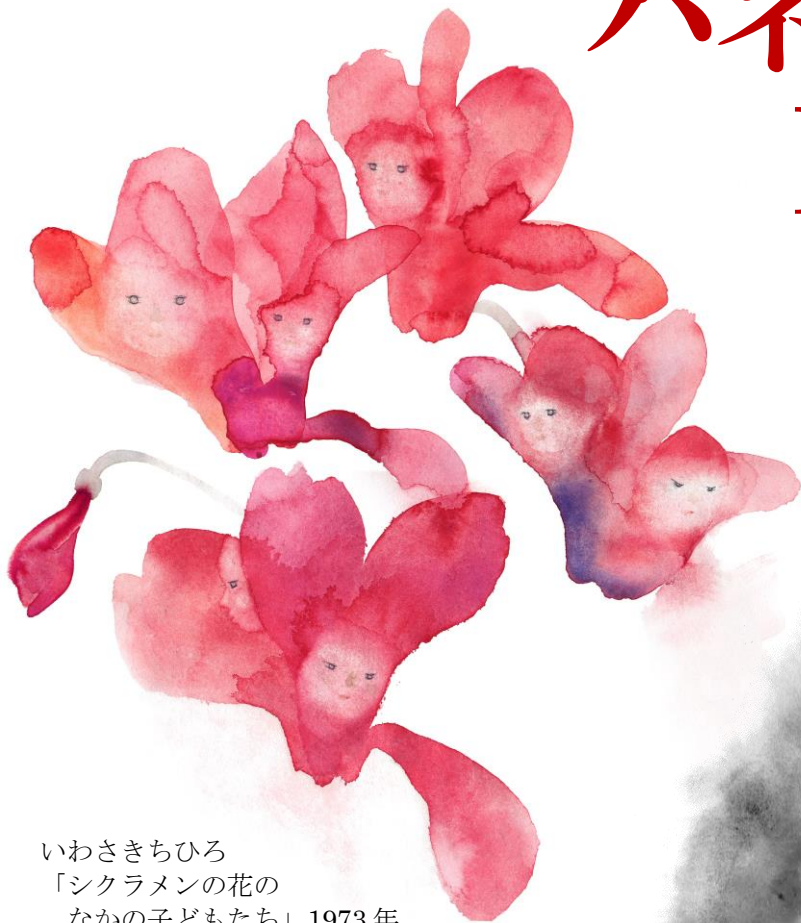
いわさきちひろ 「シクラメンの花の なかの子どもたち」1973年