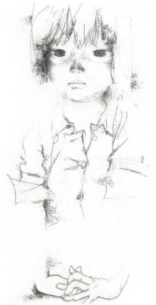
いわさきちひろ 「見つめる少女」 1967年

青春時代に戦争を体験したいわさきちひろは、一貫して平和を願い、命の大切さをあらかず作品を生み出していった。戦火に追われ赤ん坊を抱きしめる母親の必死な表情、未来を失い茫然とした子ども…彼女はかけがえのない命の一瞬を切実な思いを込めて描き続けたのである。