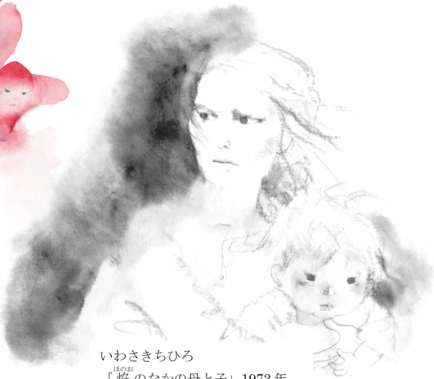
いわさきちひろ 「 ほのお 焔のなかの母と子」1973年