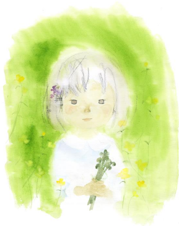
いわさきちひろ 「わらびを持つ少女」 1972年

現在、東京都練馬区と長野県の安曇野に美術館があり、年間を通じて彼女の作品を愛する多くの人たちが訪れている。